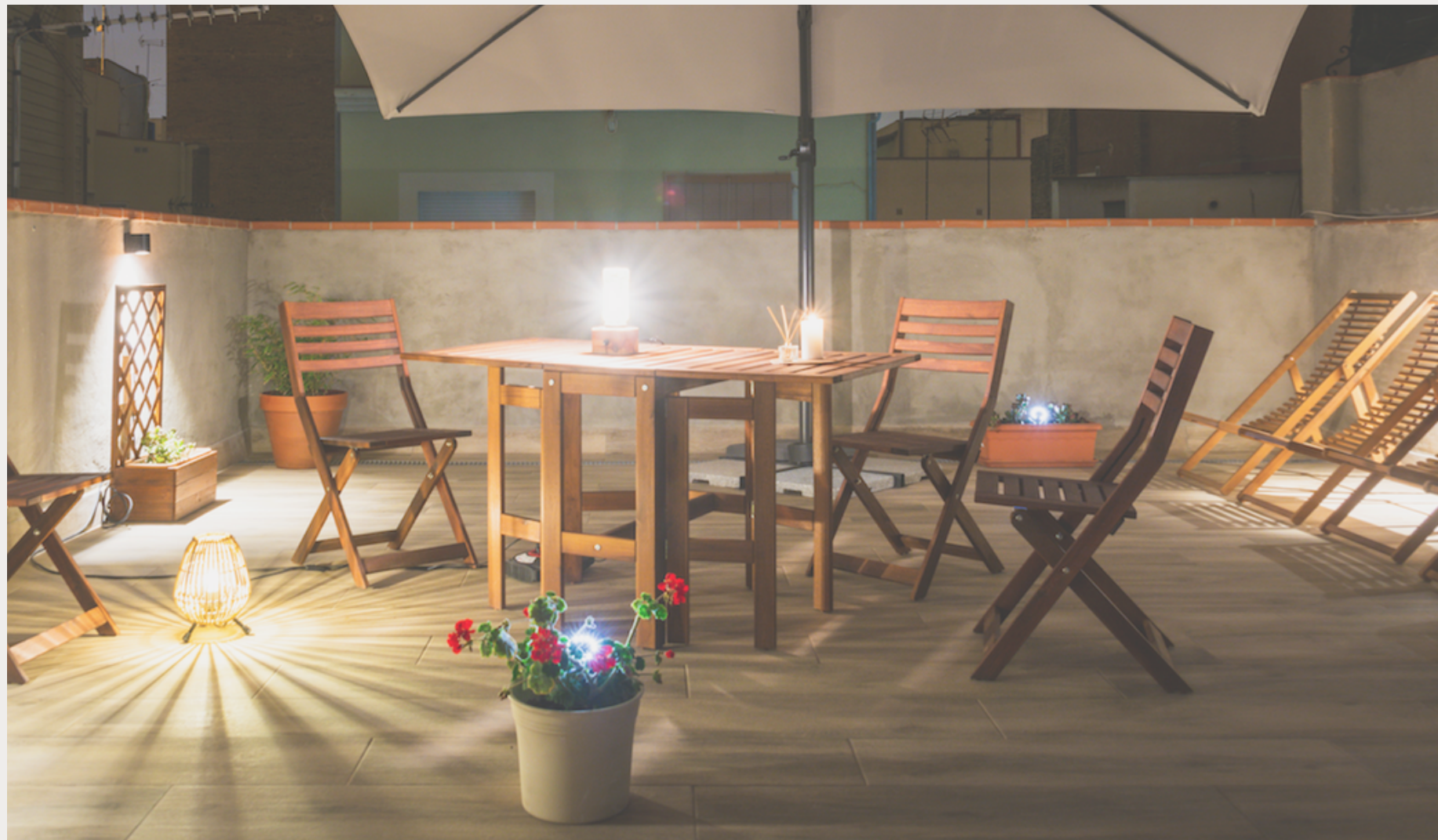
La terrasse sur la toit