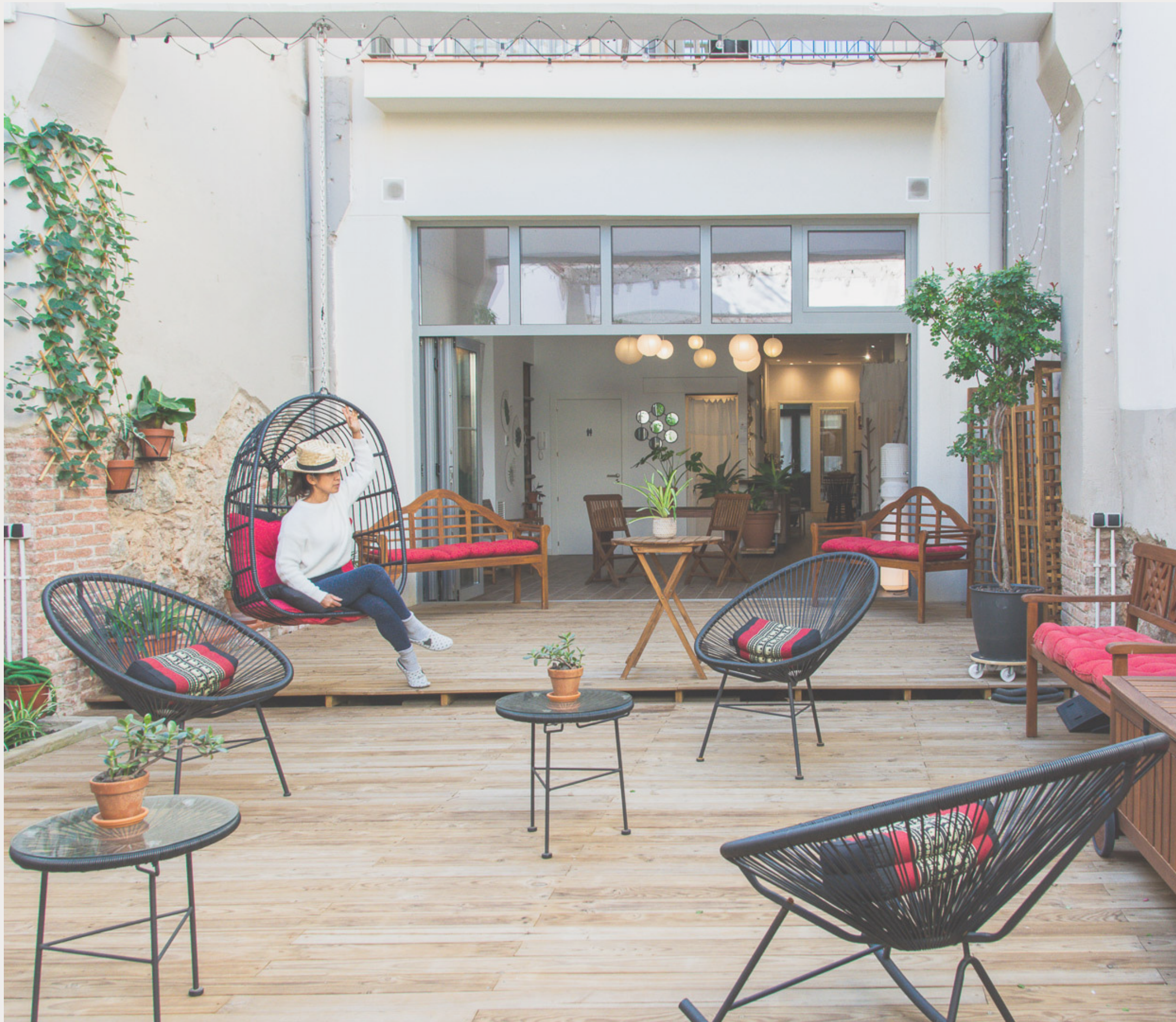
Activités sur place